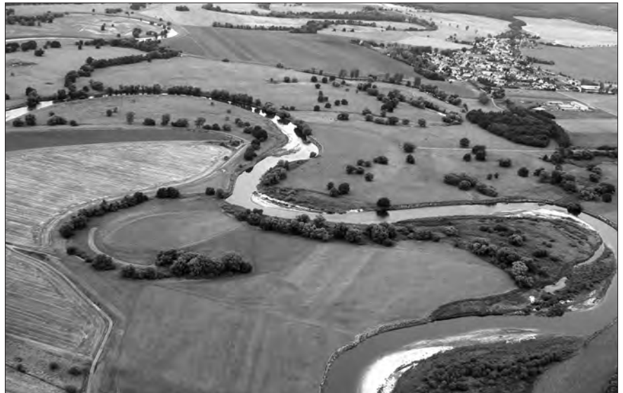
Menschen werden dem „Bedürfnis“ der Mulde (nordöstlich von Leipzig) gerecht und lassen den Fluss – letztlich im humanen Eigeninteresse – mäandrieren.

möglich der fast paradox erscheinenden Leistung des Bewusstseins, auf die „Stimmen“ der anorganischen Materie, der Pflanzen und Tiere zu hören und deren Botschaften vorrangig zu integrieren? Ist insofern nicht Nachhaltigkeit conditio sine qua non für Selbstfürsorge bzw. Selbstliebe?